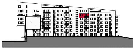
7. NADZEMNÍ PODLAŽÍ